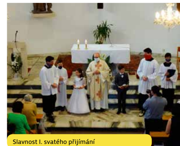
Slavnost I. svatého přijímání