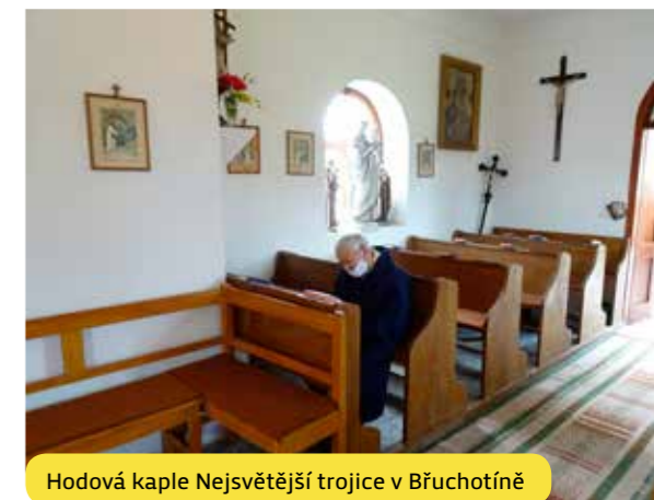
Hodová kaple Nejsvětější trojice v Břuchotíně