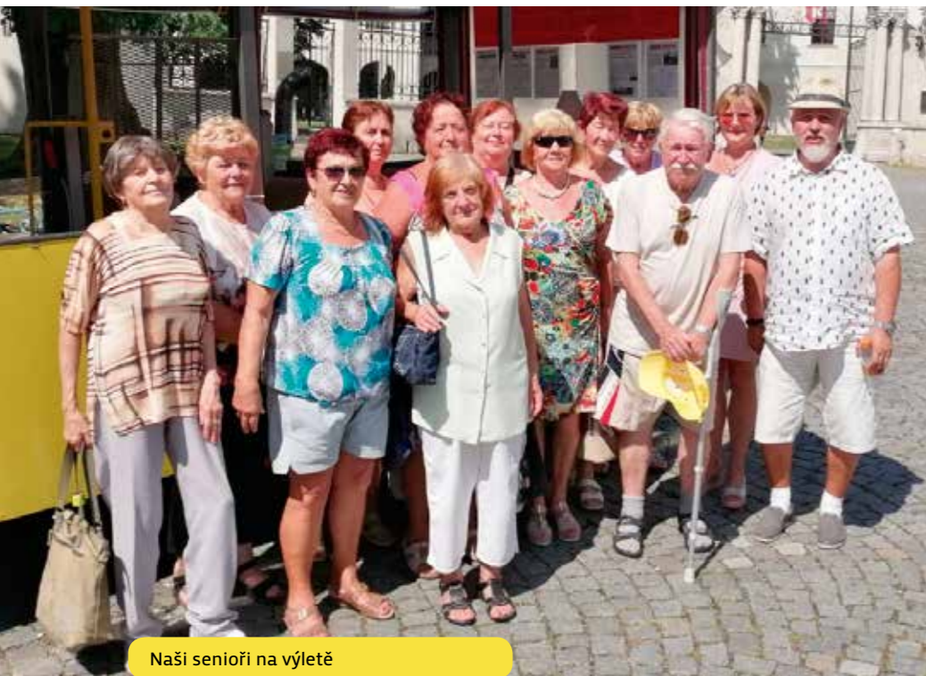
Naši senioři na výletě