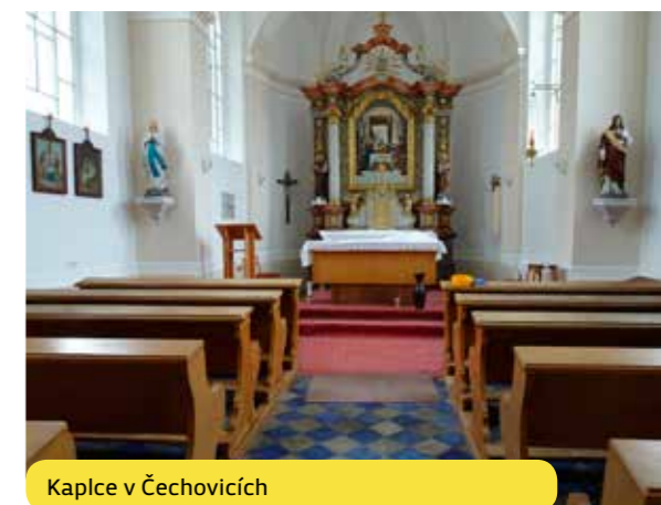
Kaple v Čechovicích